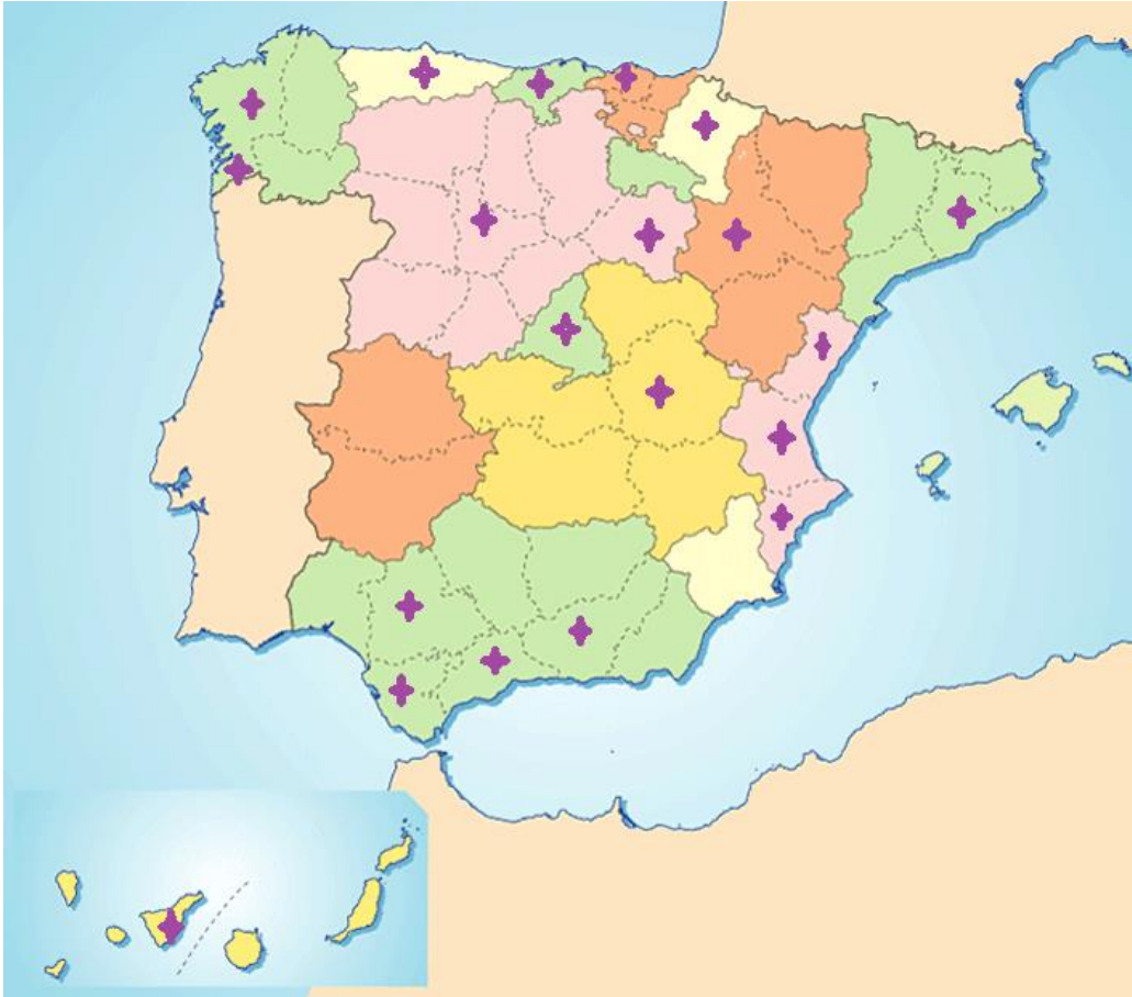
IMAGEN. Representación de distribución geográfica de miembros de GIDSEEN